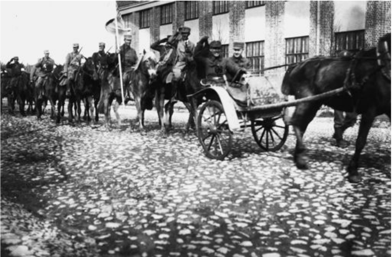
Sinä päivänä, jona Kalmin olisi pitänyt johtaa hyökkäystä Vierumäelle, hän marssi joukkoineen Lahteen. Kaupungin läpi kuljettiin paraatimarssia. – Lahden kaupunginmuseo.

si vastarintaa Härkälässä, missä noin 200 punaista yllätti rynnäköllään valkoisten marssikolonnan. Härkälän ja Vierumäen välisellä hiekkakankaalla alkoi ankara taistelu.