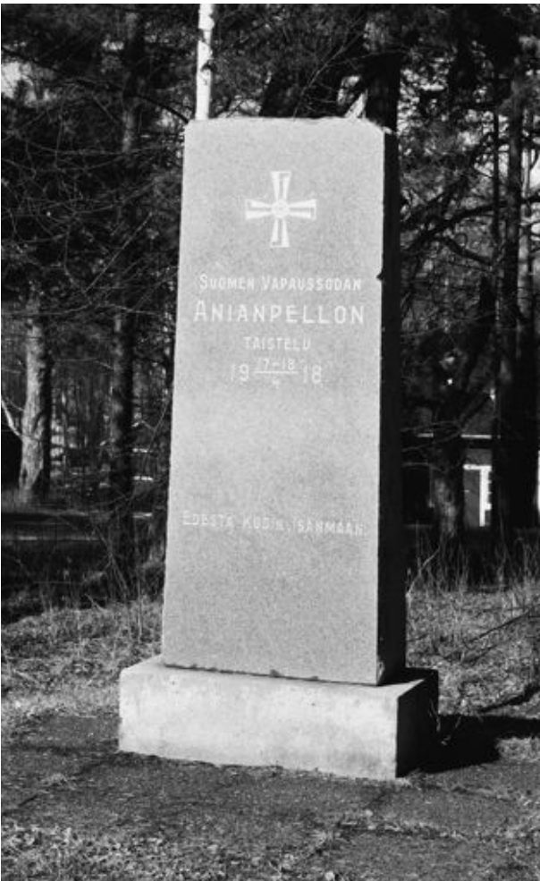
Anianpellon taistelun muistomerkki Kustaa III:n metsikössä Anianpellontien varrella. Se on pystytetty paikalle, jossa oli asemissa yksi valkoisten konekivääreistä.